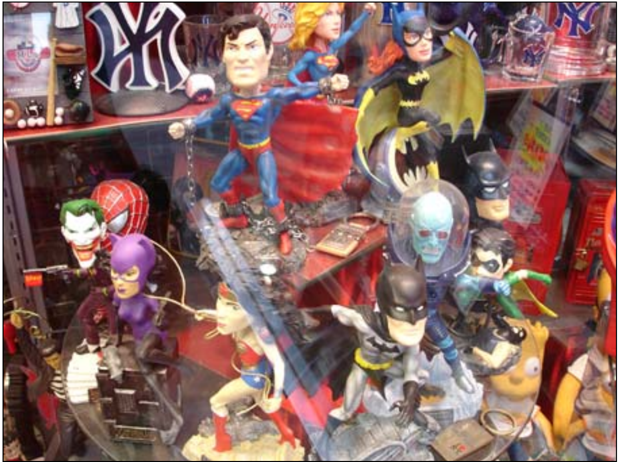
Décor urbain de cinéma de S.F. Batman, Superman et Spiderman me frôlent et Joker souri devant mon incrédulité de bouffeur de grenouilles...