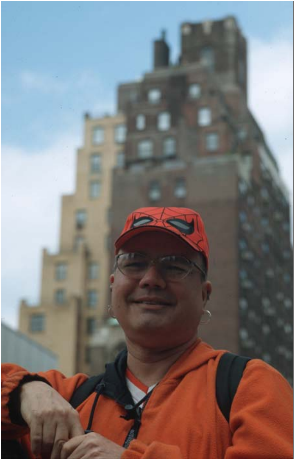
Tiens! le frère de Spiderman...